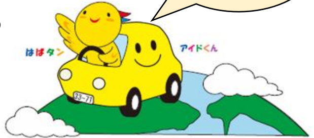
兵庫県マスコット はばたん